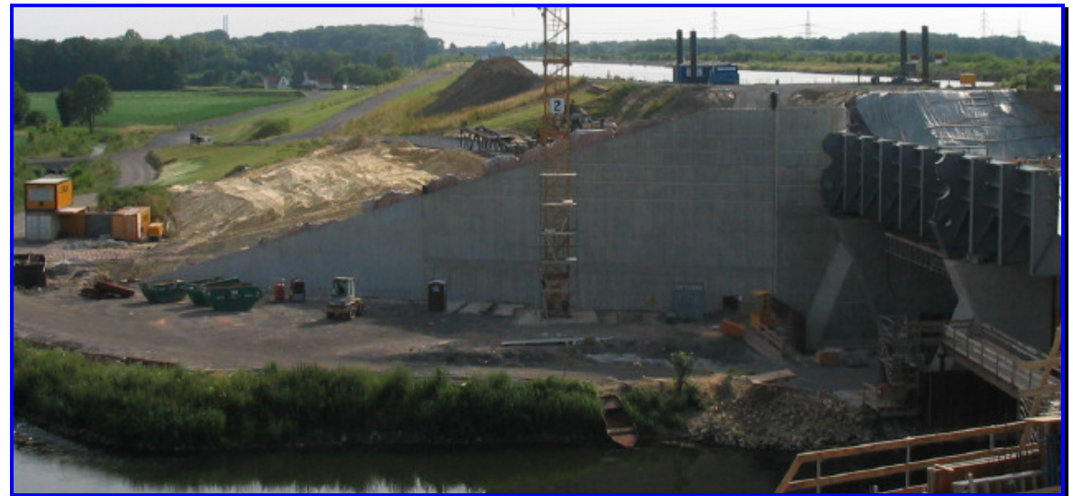
Bild links, Stützwand im Bauzustand

Die mächtige Flügelwand zur Stützung der Kanalseitendämme (max. Stützhöhe ca. 16 m) erhielt in Bereichen kleinerer Geländestützhöhen eine Flachgründung . In höheren Stützbereichen wurde eine Pfehlgründung ausgeführt (siehe nebenstehendes Bild).