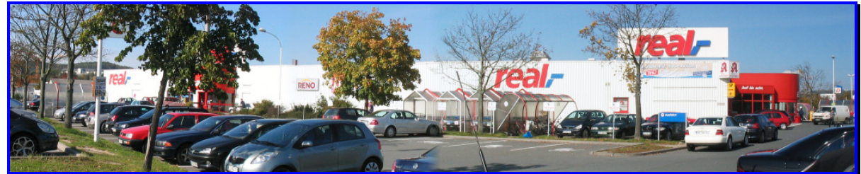
Bild 1, Verbrauchermarkt

„Hinweise für die Überprüfung von baulichen Anlagen durch den Eigentümer / Verfügungsberechtigten“