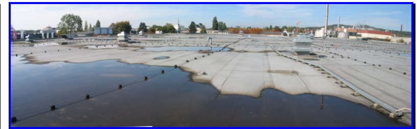
Bild 5, Dachfläche

Leistungen: - Eingehende Überprüfung als besonders fachkundige Person gem. Pkt. 4.2.3 der o.g. Richtlinie - Erstellung des Bauwerks-/Objektbuch gem. Pkt. 3 der o.g. Richtlinie